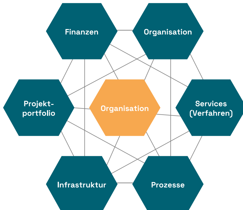
Abbildung 1: IT-Domänenmodell

Zur Bestimmung der Ausgangslage bietet es sich an, die IT-Strategie anhand mehrerer Kategorien zu untersuchen. Dazu kann Ihnen das IT-Domänenmodell (s. Abb. 1) als Grundlage dienen. Dieses unterteilt die Strategie in sechs Bereiche: Finanzen, Organisation, Services, Prozesse, Infrastruktur und Projektportfolio. Die konkreten Kategorien und Fragestellungen zu den einzelnen Domänen finden Sie in der „Bestandsaufnahme Schul-IT (Schulträger)“ (Modul „Bestandsaufnahme“).