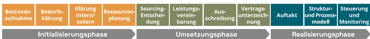
Abbildung 2: Vorgehensmodell für die Einbindung von IT-Dienstleistern

Im Prozess der IT-Dienstleister-Einbindung lassen sich elf Schritte identifizieren, die bis zur Steuerung des Dienstleisters im Betrieb erfolgen (s. Abbildung 2). Diese werden im Folgenden zusammenfassend dargestellt. Eine detaillierte Darstellung der Schritte erfolgt nach den Phasen sortiert in den nachfolgenden Kapiteln. Praktische Hilfestellungen zum Durchlaufen der einzelnen Schritte inkl. der möglichen Arbeitsaufträgen, Leitfragen und Formaten, finden sich in dem separaten Dokument „Umsetzungshilfe“ (Schul-IT-Navigator: „Handreichung – Einbindung und Steuerung von IT-Dienstleistern in der Schul-IT“ (Modul: „IT-Steuerung und Kooperation“)).