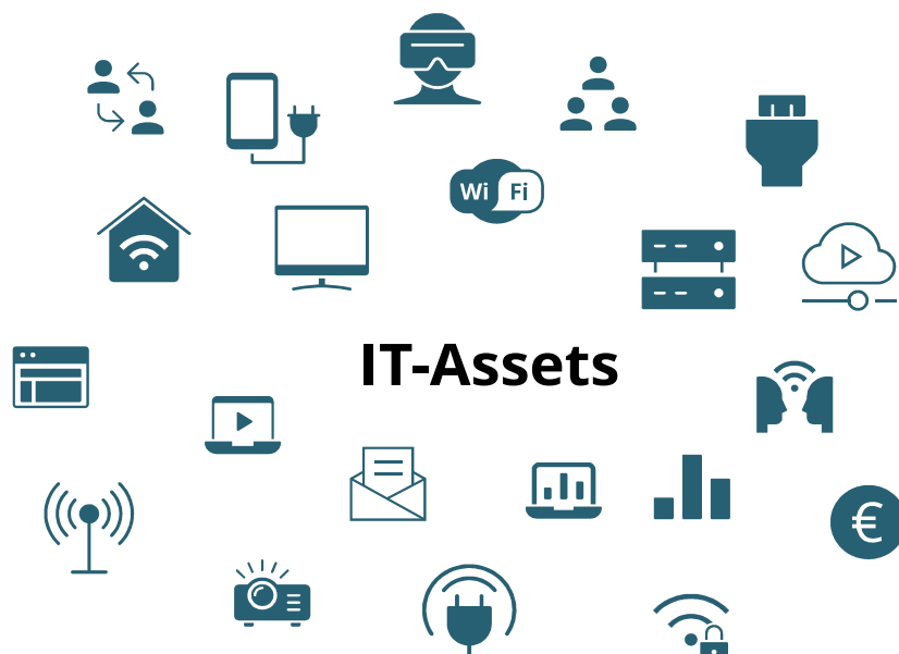
Abbildung 1: mögliche IT-Assets (eigene Darstellung)